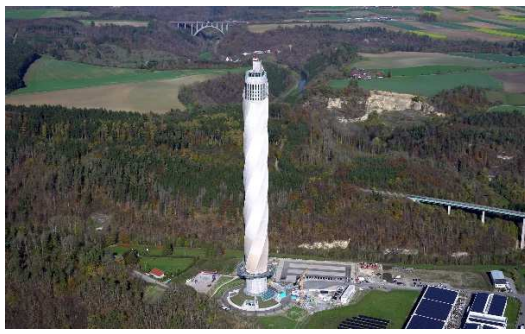
Testturm in Rottweil

gez. Kreis-Jugendfeuerwehrausschuss Oberallgäu